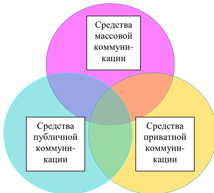
Рисунок 3. Схема гражданской коммуникации

В последнее время все более значимое место в системе каналов гражданских коммуникаций занимают интернет и мобильная связь. Именно через эти каналы индивиды чаще всего получают и передают информацию, выражают свои мнения. Интернет выступает одновременно и как среда, имеющая собственную публику, и как источник информации для других медиа-средств. Он является также «творцом» информационных потоков, позволяя участвовать в их создании индивидуумам и группам лиц, ранее находившимся в маргинальной ситуации. Дискриминируемые или изолируемые этнические сообщества, обездоленные социальные группы, местные общественные движения, запрещенные политические формирования – все они находят в Интернете средство появиться на сцене, собственными словами рассказать о своем положении, сформулировать свои