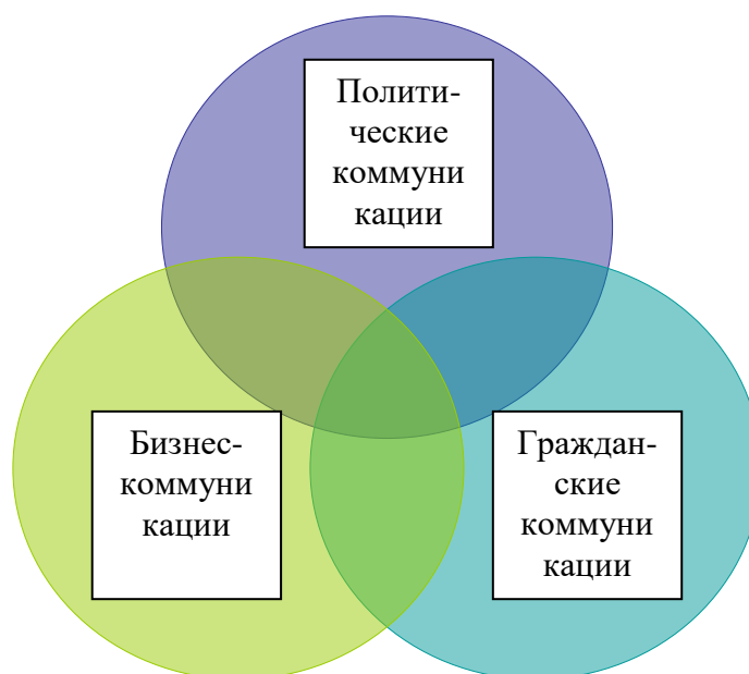
Рисунок 2. Схема взаимодействия коммуникаций

Переводя эти общетеоретические рассуждения на язык практических действий, можно сказать, что под гражданскими коммуникациями понимаются системы, которые обеспечивают: