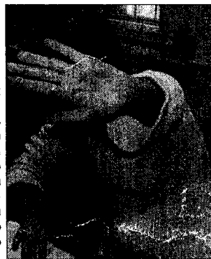
Частная жизнь – это совокупность действий и решений, скрываемый индивидом от постороннего контроля

Я не знаю ответов на много же поставленные вопросы. Я только утверждаю, что, не зная этих ответов, трудно оценить перспективность законов, призванных регулировать столь деликатную сферу.