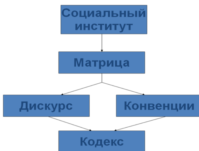
Рисунок 2 – Системная модель коммуникационной матрицы

наиболее адекватным термином для обозначения систем знаний, ценностей и норм, определяющих специфику коммуникации разных субъектов в разных ситуациях и позволяющих увязать эти системы с общесоциальной ситуацией, является понятие « коммуникационная матрица », проявлениями которой выступают дискурсы, конвенции, кодексы. Схематически эта идея отображена на рис. 2.