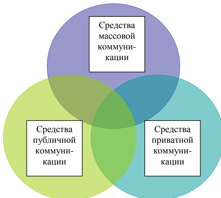
Рисунок 1. Схема общественной коммуникации

Функционирование так понимаемых общественных коммуникаций обеспечивают несколько профессиональных групп: